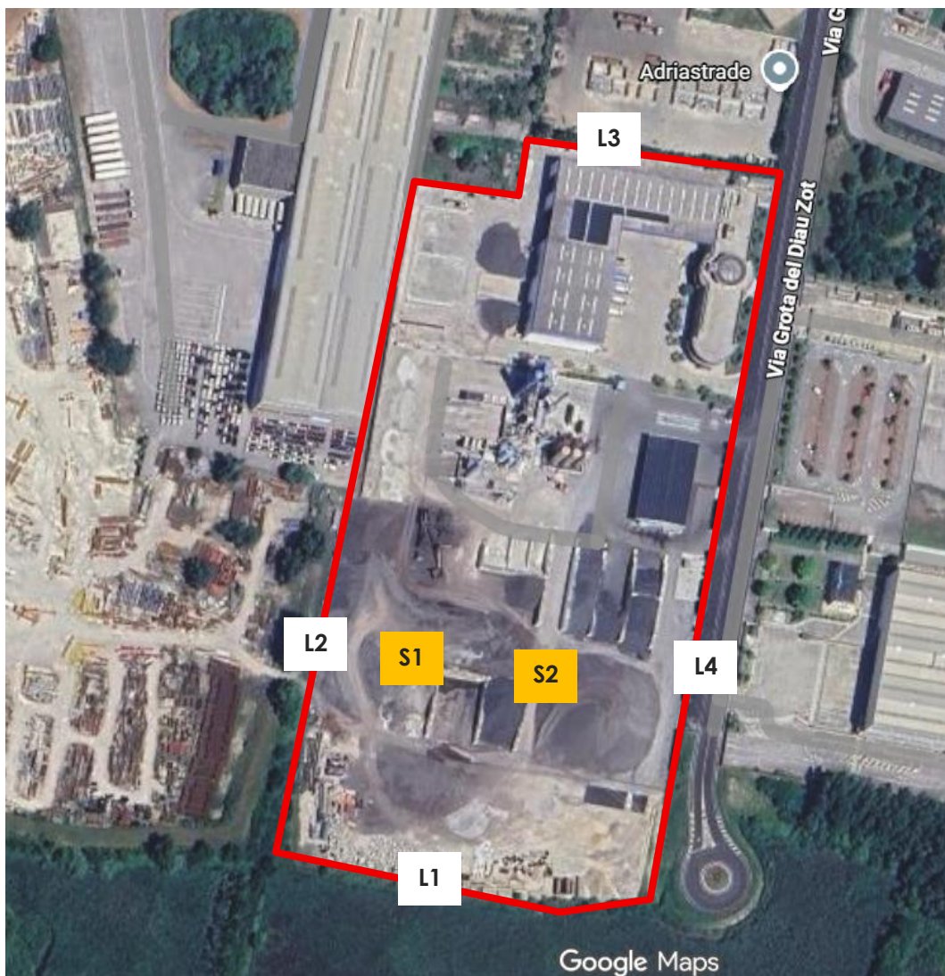
Figura 2. Localizzazione dei punti al perimetro identificati per la caratterizzazione del rumore ambientale.